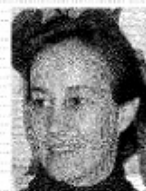
di Chiara Crocco